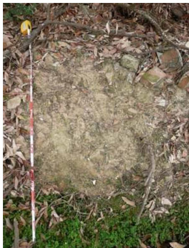
圖說：遺址北側邊坡散落之陶片